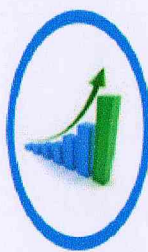
ความมั่งคั่ง