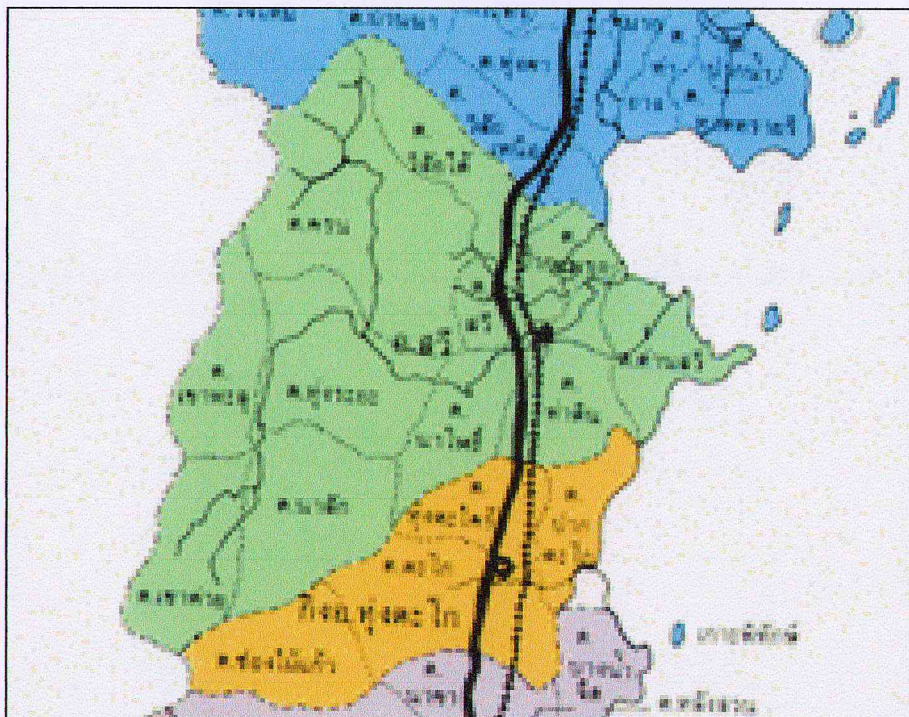
แผนที่ตำบลครน